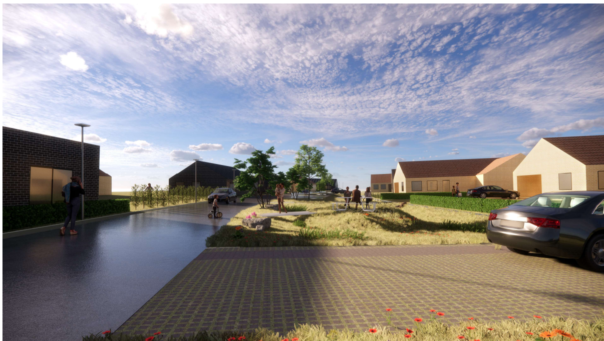
2 Østerlindparken 1 - 27, visualisering med regnbede