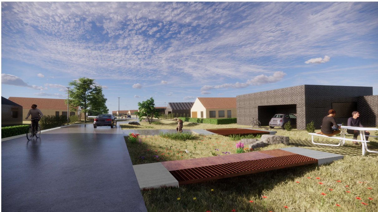
1 Tavlund Krat 2 - 26, visualisering med regnbede